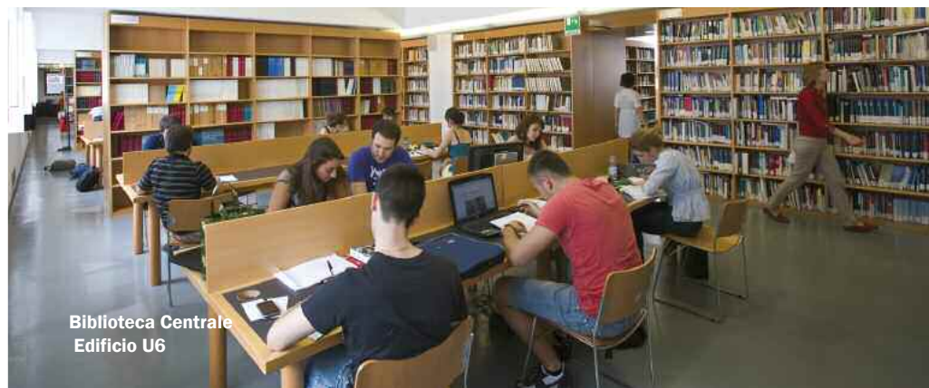
Biblioteca Centrale Edificio U6