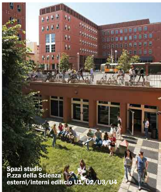
Spazi studio P.zza della Scienza esterni/interni edificio U1/U2/U3/U4