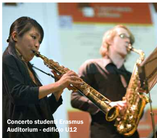
Concerto studenti Erasmus Auditorium - edificio U12

Tramite i self service delle Segreterie On Line ubicati all'interno dell'Università (o direttamente via Internet su www.unimib.it ) sia per l'iscrizione all'albo, sia per l'iscrizione alle collaborazioni proposte.