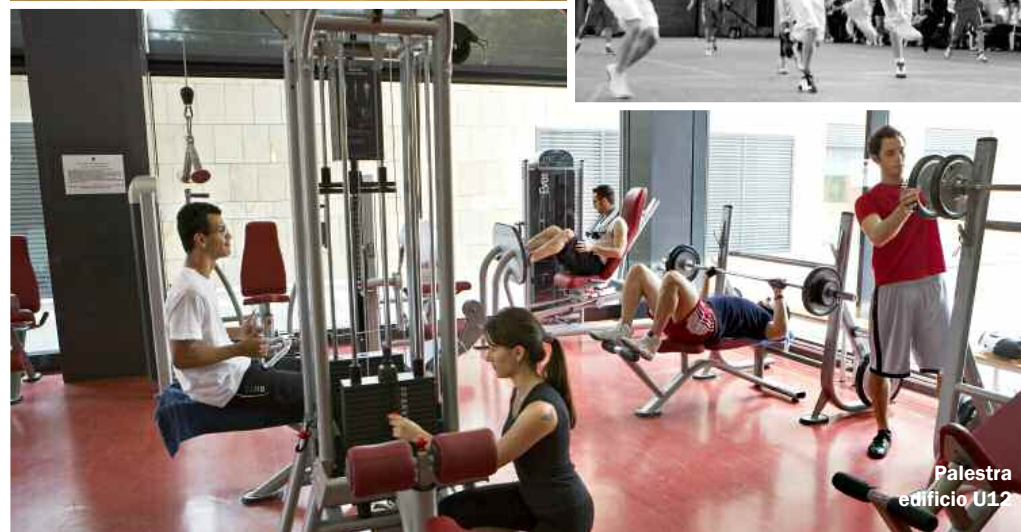
Palestra edificio U12