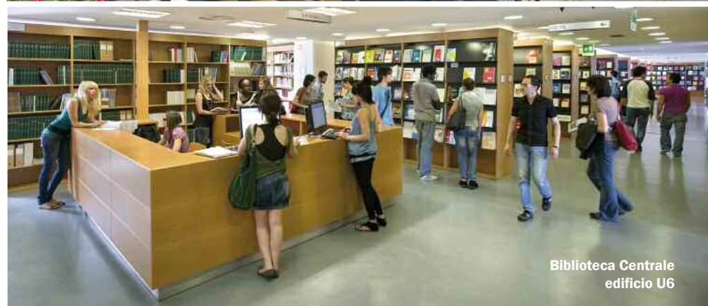
Biblioteca Centrale edificio U6