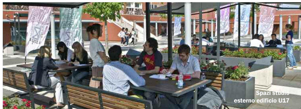
Spazi studio esterno edificio U17

Edificio U6 - piano terra P.zza dell'Ateneo Nuovo, 1 - 20126 Milano Tel: 02 6448.6986 (dal lunedì al venerdì, dalle 9:00 alle 12:00 e dalle 14:00 alle 17:00) Fax: 02 6448.6067 E-mail: info.disabili.dsa@unimib.it